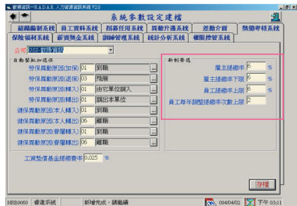
圖一：R.A.D.A.R.簡單的參數設定示意圖

R.A.D.A.R.提供人資部門一套完整的『選、用、育、留』解決方案。我們將勞退新制中的薪資、獎金視為「留才」機制，系統除提供員工選擇新舊制之功能外，有關員工個人提繳及企業（雇主）提繳的計算與統計分析之資訊，對人資部門而言尤其重要，透過R.A.D.A.R.系統簡單的參數設定，就能立即掌握並隨時取得相關報表（如圖一所示）。若企業的人資部門需應政府主管機關之要求，而需提供該企業員工的勞健保及所得稅等相關之申報資訊時，人資部門透過系統的輔助，可立即取得所需之資料，大幅節省HR人員收集、彙整資料的時間與人力，讓人資部門的人力得到最佳的發揮與利用（如圖二所示）。